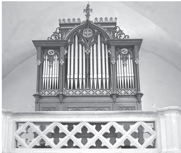
2. ábra: Tövisi orgona, Takácsy Ignác 60. alkotása